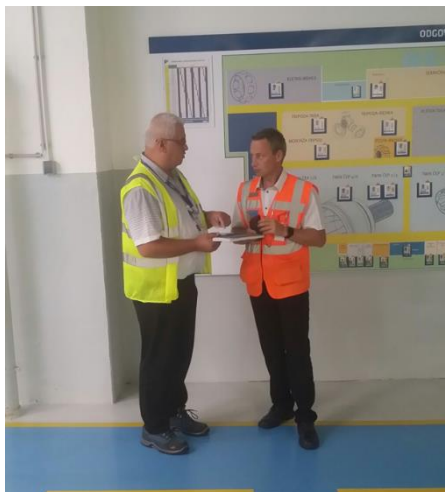
Orodje DAM, lahko uporabimo tudi v primeru izvajanja GEMBA obhoda (GEMBA WALK).