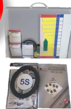
UČNI KOMPLET 5S ZA PRAKTIČNO UČENJE koda izdelka 829110

Osnovno igro za učenje metode 5S je mogoče nadaljevati s praktično implementacijo metode 5S.