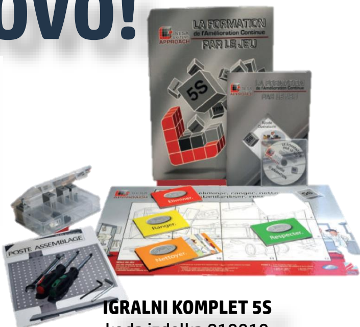
IGRALNI KOMPLET 5S koda izdelka 819010